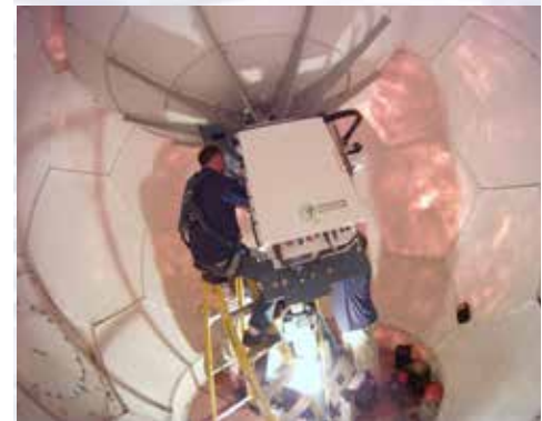
Los técnicos trabajan en la antena de satélite en el domo VSAT. Imagen: NOAA Okeanos Explorer Program, Galapagos Rift Expedition 2011.

http://oceanexplorer.noaa.gov/okeanos/explorations/ex1202/logs/apr13/media/apr13-2.html