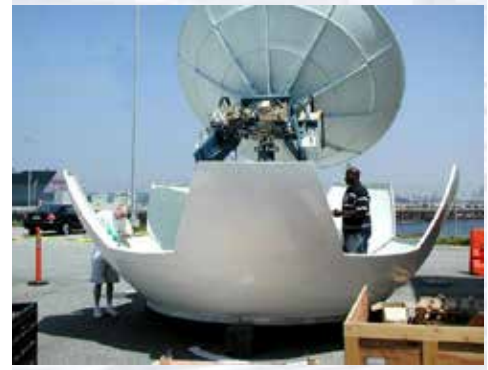
Montaje del VSAT para el Okeanos Explorer en el astillero de Fairhaven en Bellingham, WA, 2007.

Durante las expediciones, la comunicación por voz en tiempo real se complementa con una herramienta en tiempo real basada en texto llamada "Eventlog" (Registro de un evento), que le permite a cada observador científico escribir sus observaciones en un registro digital común, o basado en una computadora. Las entradas del registro son visibles inmediatamente por todos los usuarios. Se alienta a todos los usuarios -en el buque y en los ECC- a participar del Eventlog, ya que cada individuo es capaz de proporcionar observaciones y conocimientos únicos de lo que se está observando por primera vez a través de los "ojos" del ROV. La exploración oceánica es, por definición, multidisciplinaria y, como tal, los científicos con diferentes áreas de experiencia deben